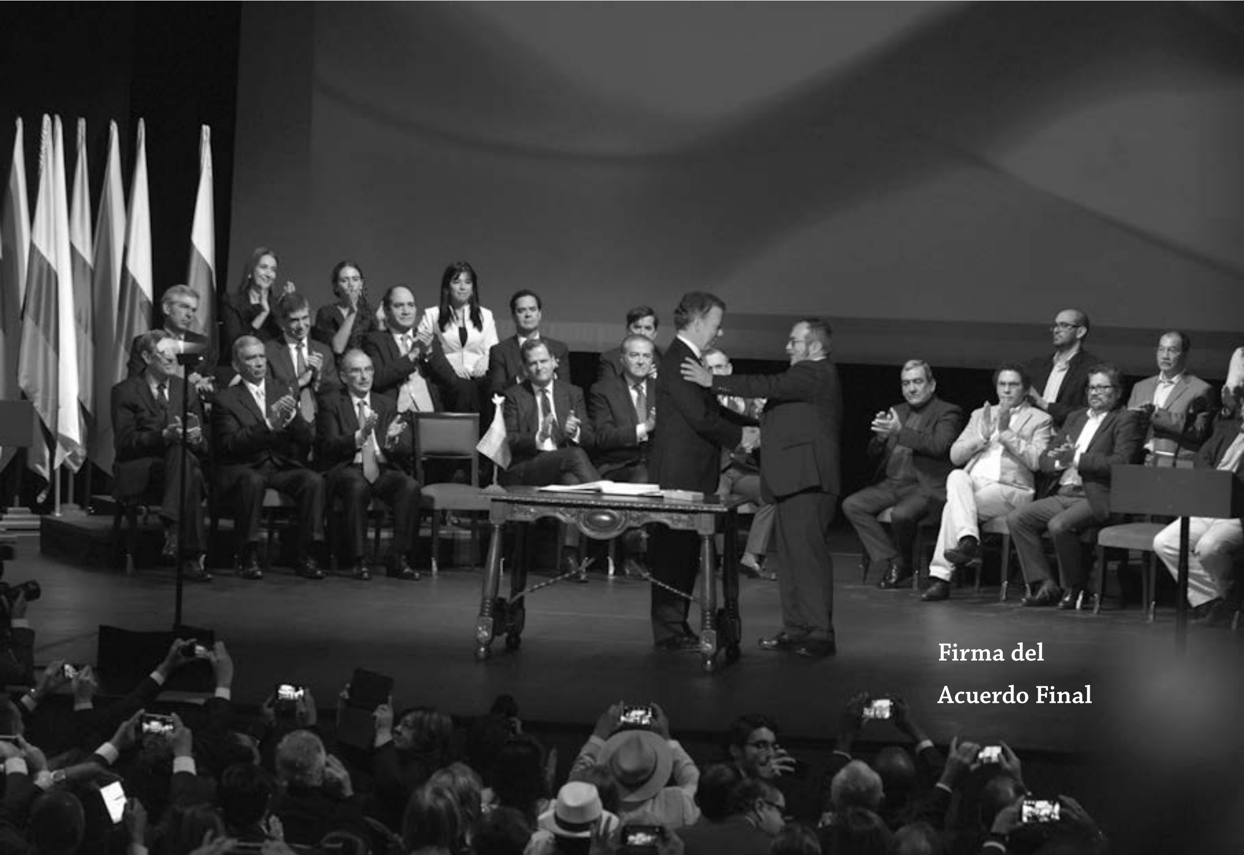
Firma del Acuerdo Final